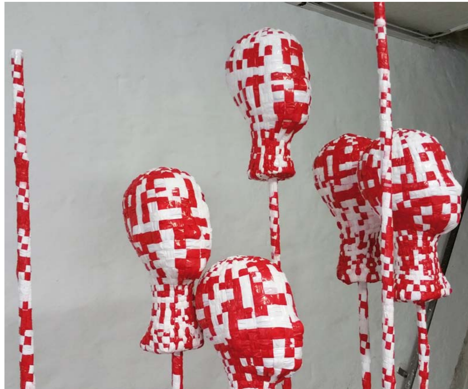
PERIHEL UND APHEL | 2017 | Folie, gewebt 16-teilig | 10 Stelen max. 195 cm hoch | 6 Kugeln max. 50 cm Durchmesser

2016 gründet sie das „Atelier PhoenixWest“ in Dortmund Hörde. Birgit Feike lebt in Schwerte an der Ruhr.