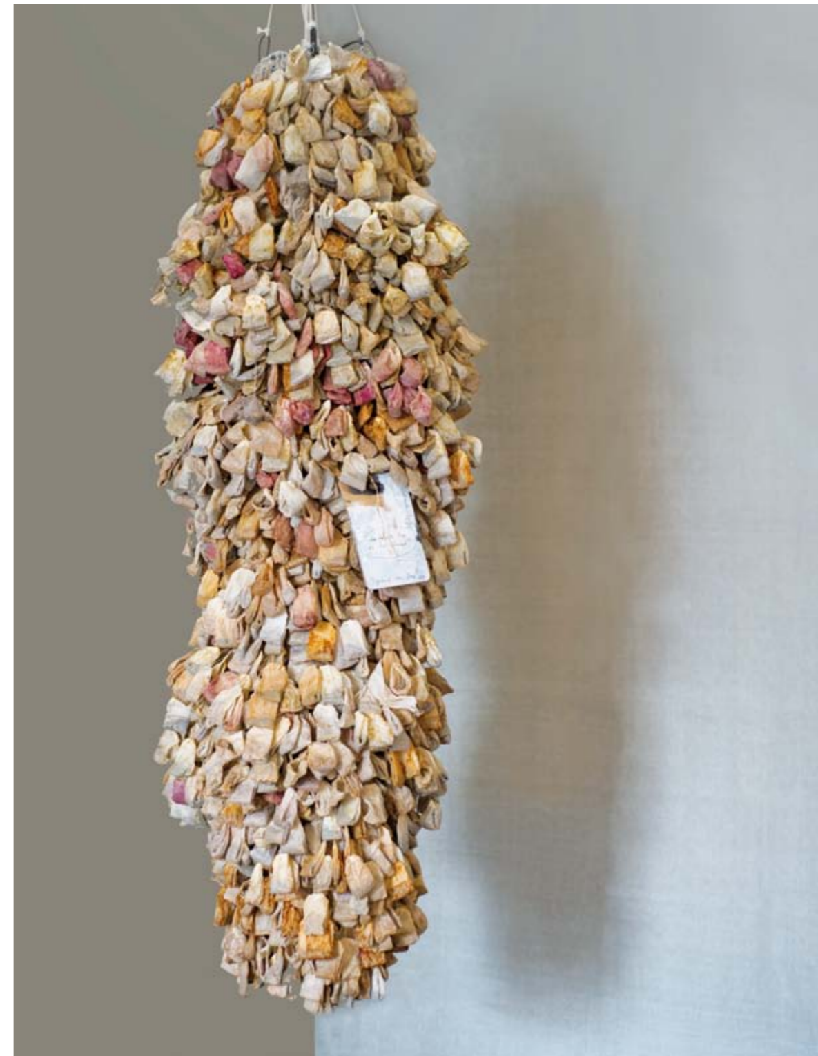
ICH TRANK TEE, ALS IHR STARBT, TAGEBUCH 10 (2016/2017) | Teebeutel von getrunkenem Tee, Draht | 200 x 60 cm

Teetrinken, dazu Kriegs- und Terrornachrichten und der Blick auf die menschliche Existenz führten 2007 zur Arbeit an den Tagebüchern. Ohnmacht und Ratlosigkeit lagern sich im Teebeutel ein. Als Zeitzeugen getrocknet und im Drahtgeflecht verknüpft, werden sie zu Tagebüchern. 2018 beginnt die Arbeit an Tagebuch elf.