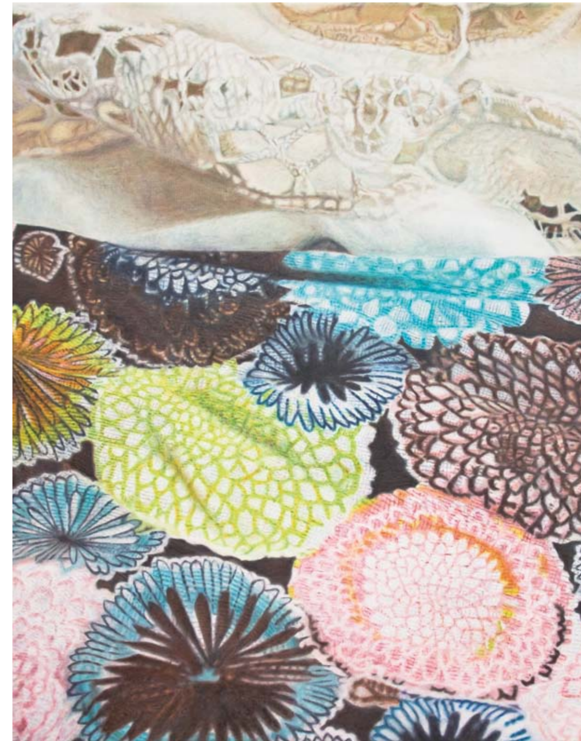
o. T. | 2012 | Öl auf Nessel | 100 x 90 cm