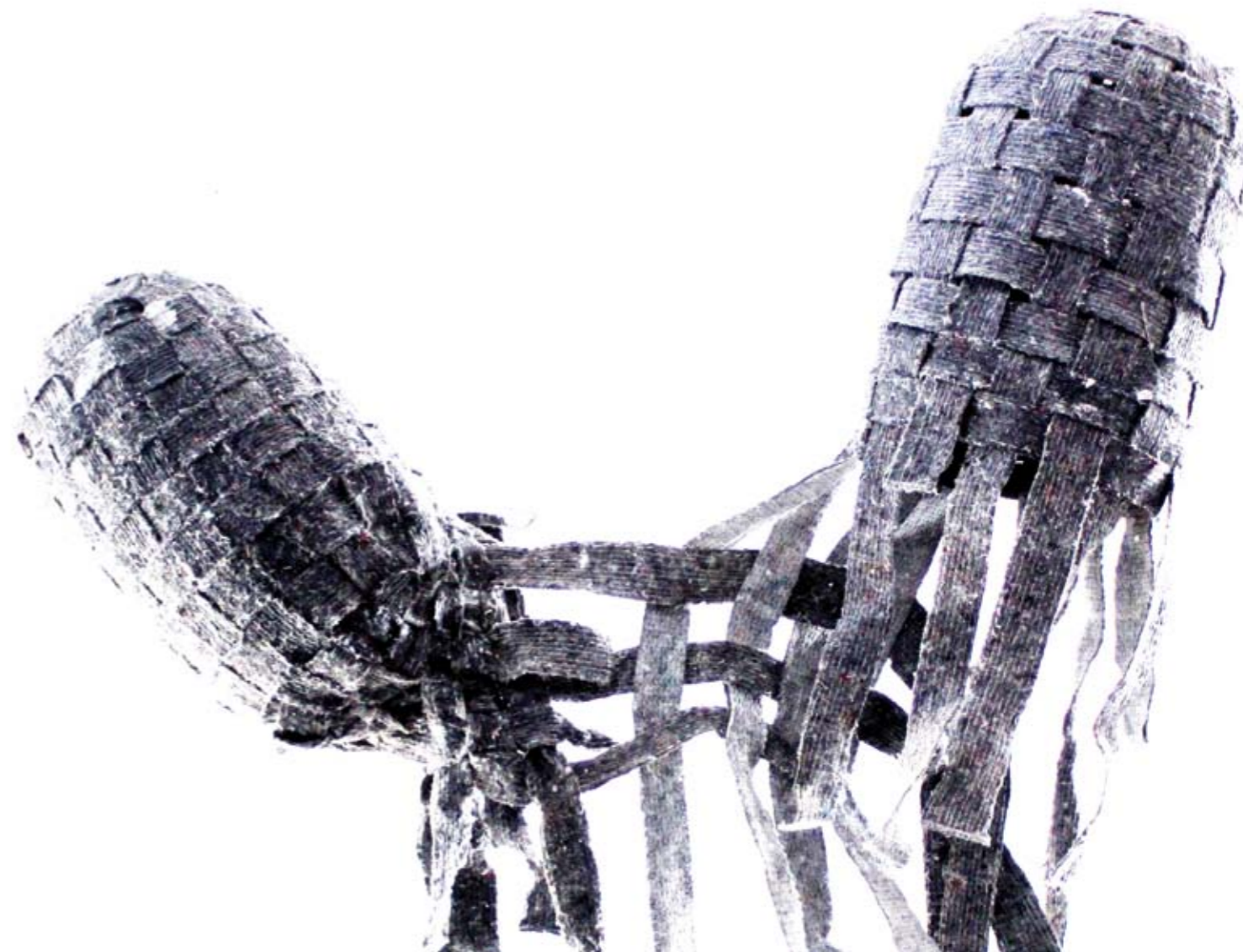
VERFLOCHTEN (aus Werkserie Kokons) | 2018, Filz und Latex | 90 x 80 x 30 cm

Die inhaltliche Thematik meiner Arbeit „Kokons“ geht aus von der Idee der Zelle als Einheit. Sie behandelt das Geborenwerden und sich Öffnen (-müssen – bereitwillig oder zaghaft –) und untersucht die damit verbundenen unterschiedlichen Strategien des Selbstschutzes. Es geht um das sich Vernetzen und Verflechten, das Suchen und Finden des Anderen bis hin zur Auflösung, das passive Warten, Ergriffenwerden und das aktive Fühlen und Erfassen. Die Kokons behandeln die Angst vor Verletzung und Zerfall, die mit der Sehnsucht nach Öffnung und Verbundenheit korreliert, und zeigen die Einsamkeit in der Isolation aber auch die Geborgenheit des Mit-Sich-Eins-Seins.