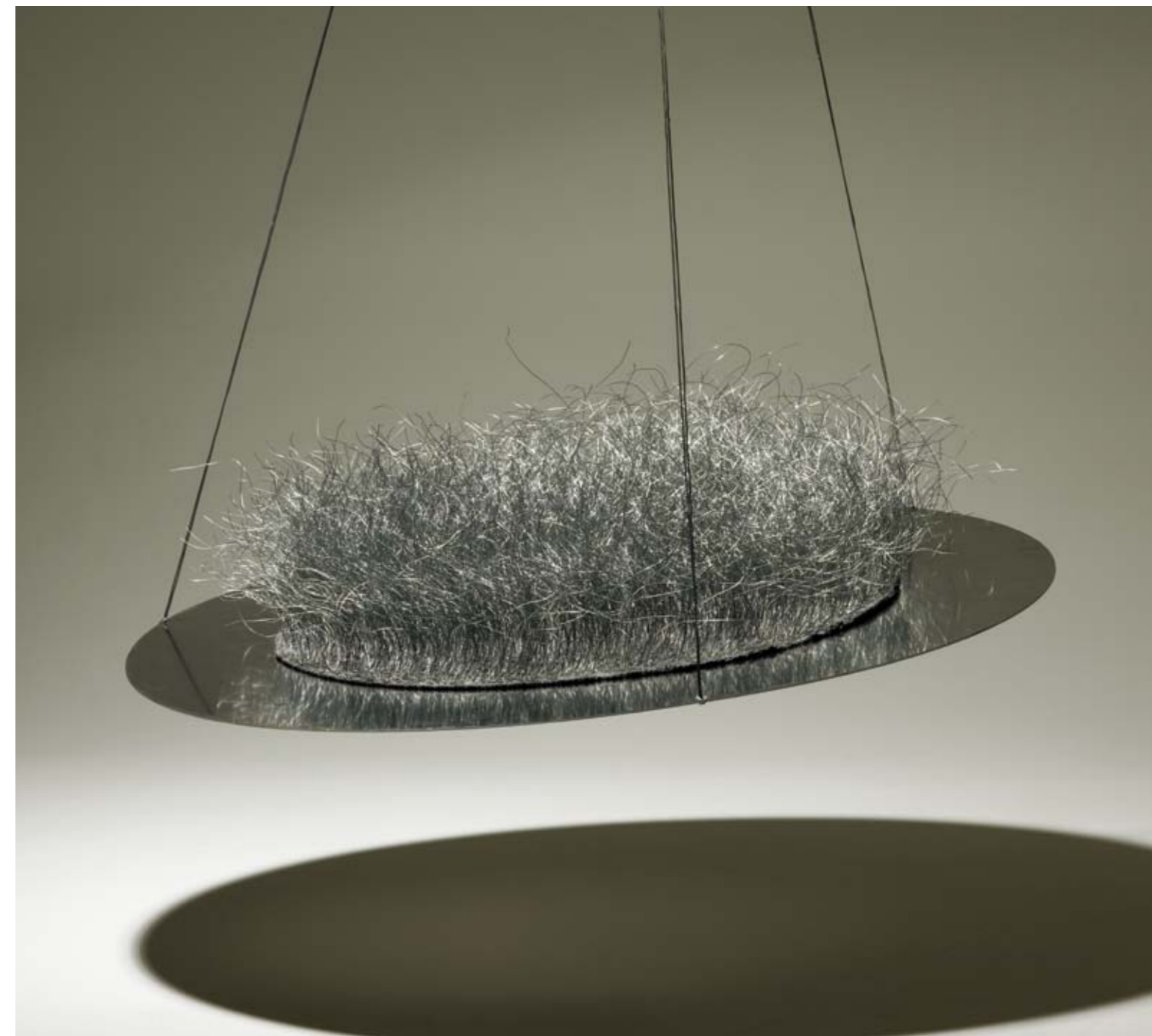
ARKADISCHER TRAUM | Soft Art / Installation | 2009 | Wolle, Stahldraht auf Aluminiumplatte | 100 cm x 100 x 15 cm

Annie Fischer beschäftigt sich in ihren Arbeiten mit der subtilen Seite unterschiedlicher Materialitäten und deren Wahrnehmung. Neben textilen Fasern verwendet sie häufig Materialien aus dem Baumarkt, die ihrer zweckgerichteten Funktion enthoben und in einen neuen Zusammenhang gebracht werden. Formale Kriterien des Verflechtens finden sich z.B. in Hasendraht wieder. Die Technik an sich wird thematisiert und zieht sich wie ein roter Faden durch ihre Arbeiten.