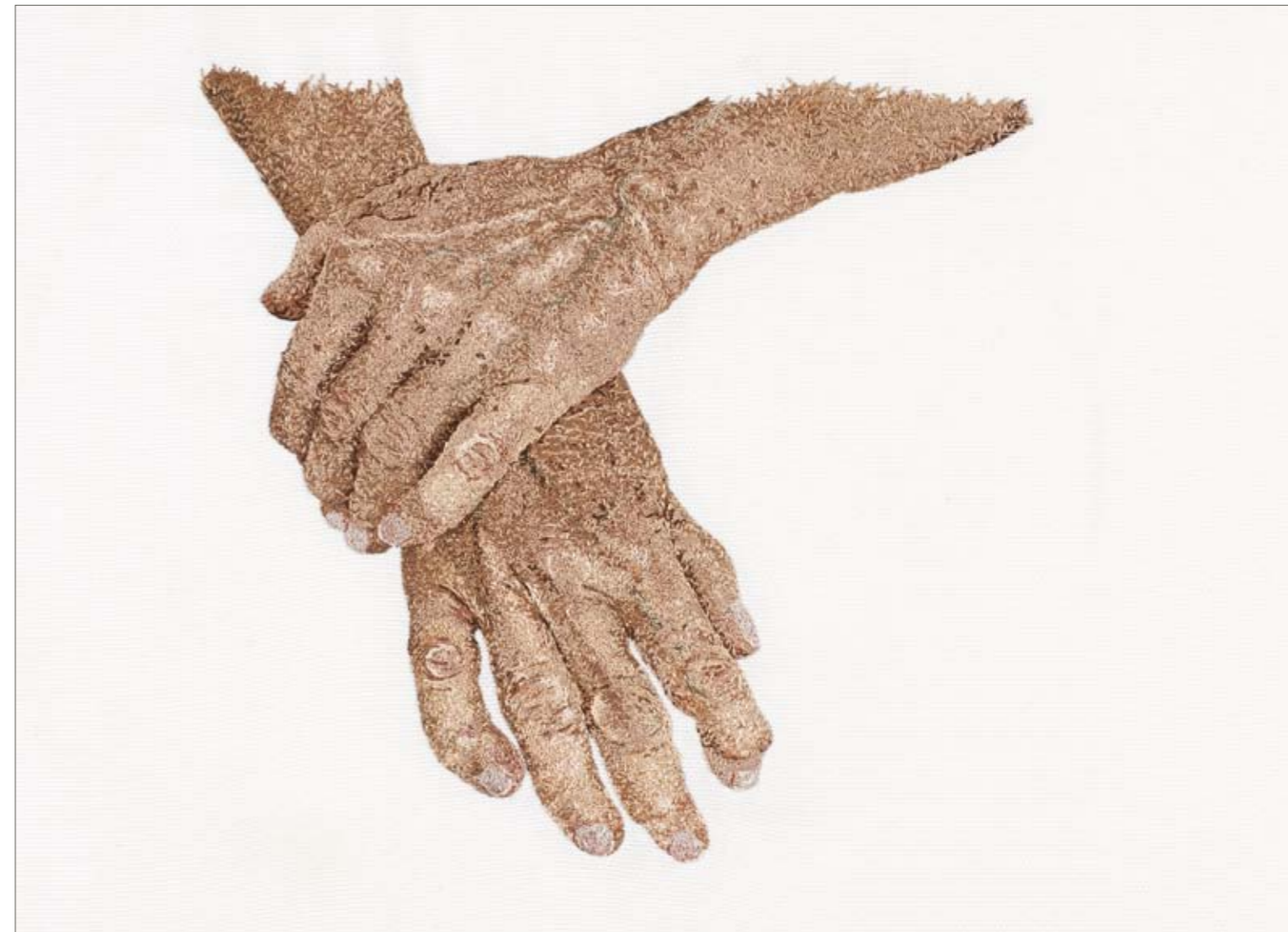
HÄNDE 1 | 2015 | Handstickerei, Baumwolle | 42 x 64 cm

Die Künstlerin Lisa Reichmann zeigt in ihrer Serie „Hände“ eine Art Porträt ihrer Familie. Das Bild der Hände ist Ausdruck des gelebten und noch zu lebenden Lebens. Mit den Händen geschieht der unmittelbare körperliche Kontakt mit der Realität. Die Hände greifen in das volle Leben ein und tragen im Laufe der Zeit Spuren davon. Für das Bildmotiv sollten die Hände entspannt im Schoß liegen. So erscheinen die kleinen Unterschiede in der Handposition jeder Person. Die Arbeiten werden in einer freien Technik der Handstickerei ausgeführt. Auf einem Baumwollgewebe überkreuzen sich die Fäden, bis sie sich zu einer komplexen Textur verbinden.